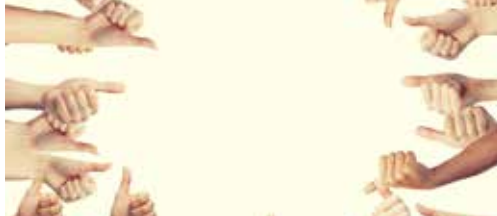
Halfweg en perfect op schema p. 2