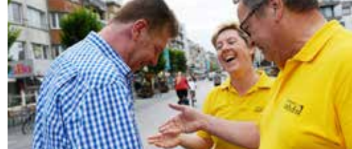
Zot van de zee p. 3