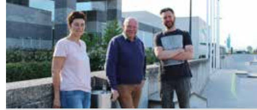
Drinkwaterfontein aan skaterpark p. 3