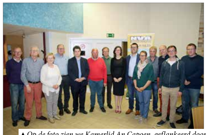
▲ Op de foto zien we Kamerlid An Capoen, geflankeerd door een groot deel van de bestuursleden van onze N-VA-afdeling.

An, die ook arts is in ziekenhuis AZ West in Veurne, bewees eens te meer dat onze uitstekende gezondheidszorg internationaal aan de top staat. Maar om dit zo te houden moet er gewerkt worden aan meer efficiëntie. Ons zorgmodel wordt anders onbetaalbaar, waardoor we allemaal dreigen te verliezen. Hoe hervormen zonder de patiënt te raken. En hoe pakken we de verschillen tussen Vlaanderen en Wallonië aan, zodat de prijs voor de Franstalige medische overconsumptie niet langer betaald wordt door de Vlamingen? An gaf een duidelijk antwoord op deze en vele andere vragen van het geïnteresseerde publiek.