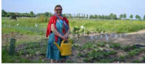
Samen tuinieren op Zeevette p. 2