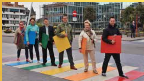
Actie Jong N-VA, 17 mei 2018

De N-VA zit niet stil! Op elke gemeenteraad lanceren wij nieuwe voorstellen en ideeën. Helaas worden die door de partijen van de meerderheid vaak weggestemd. Toch slagen we er ook geregeld in om door de politieke muur te breken. Een overzicht van enkele N-VA-voorstellen die eerst werden weggestemd, maar later toch werden ingevoerd. De N-VA inspireert graag! En dat zullen we blijven doen.